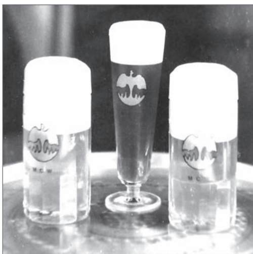
В 1991 году на «Москоксе» по немецкой технологии на зарубежном оборудовании выпускали пиво

...В непростые 90-е «Москок» вновь оказался на грани закрытия. И не только из-за смены эпох. Коксовым батареям исполнилось 40 лет, тогда как среднетехнический срок «жизни» коксовых печей — 25 лет. Требовалась срочная перекладка. Это значит, что каждую батарею нужно снести и отстроить заново! И это в условиях политического и экономического хаоса!