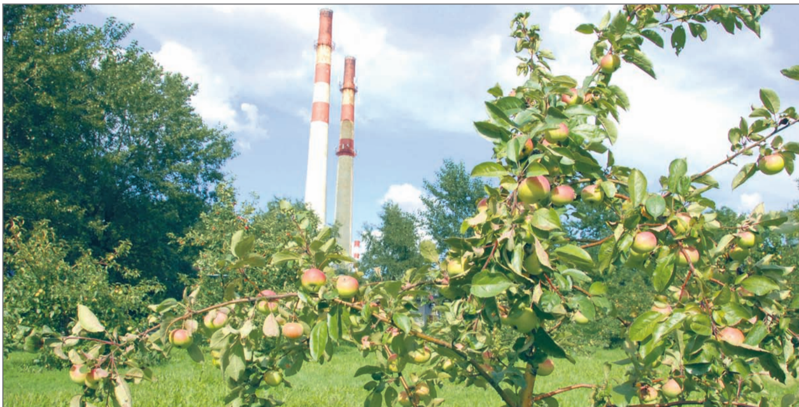
На заводской территории разбит яблоневый сад

Родилась идея использовать коксовый газ в производстве синтетического аммиака для выпуска сельхозудобрений. Надо было на базе действующего предприятия организовать новое производство — по сути, завод в заводе. И в 1965 году на базе МКГЗ впервые в отечественной коксохимии запустили производство синтетического аммиака и разделения воздуха с получением трёх чистых продуктов — азота, кислорода и аргона. Москве предназначались кислород и аргон, промышленности — кокс, сельскому хозяйству — аммиачные удобрения. А образующиеся в процессе производства газы, содержащие углекислоту, использовали для выпуска товарной углекислоты и сухого льда.