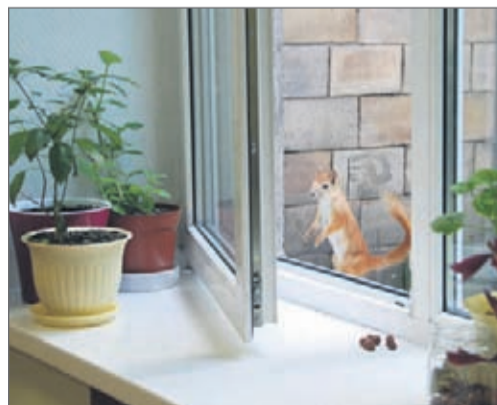
В окна заводских кабинетов, в надежде на угощение, частенько заглядывают белки

В первые годы жизни заводская территория выглядела так: здания посреди голой низины, перерезанной канавами и кучами земли. Ни деревца, ни кустика. А в ненастье — непролазная грязь. Существует то ли легенда, то ли реальный случай, как однажды в дождливый день приехал на МКГЗ важный чиновник. Ему показали завод. Он попрыгал по лужам между цехами и изрёк: